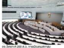
อ.วิฑูรย์ พิพิธ นัยน์กัญญา 20.03.26 | 09:28 น.