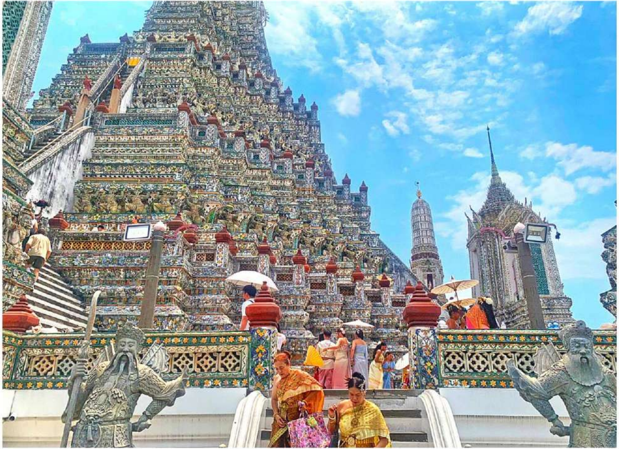
กลุ่มนักท่องเที่ยวหลากหลายถ่ายรูปในชุดไทยหลากสีบนพระปรางค์วัดอรุณฯ