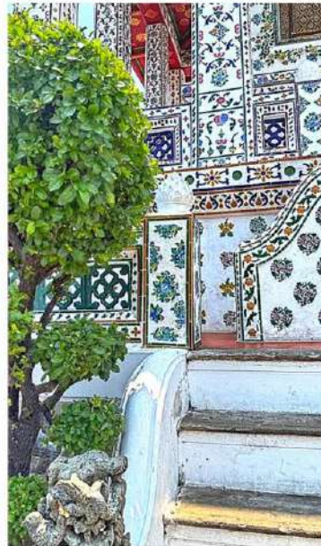
ยอดพระปรางค์สามยอดกระเบื้องเคลือบในวัดอรุณฯ เป็น highlight ที่นักท่องเที่ยวนิยมถ่ายภาพ