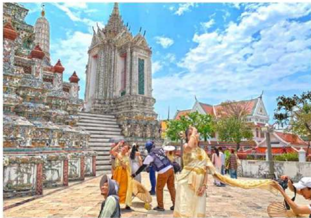
รูปของนักท่องเที่ยวต่างชาติแต่งชุดไทยในวัดอรุณฯ

เมื่อนักท่องเที่ยวเหล่านี้เดินทางกลับ พวกเขาไม่ได้นำเพียงของที่ระลึกจากประเทศไทยกลับไปเพียงอย่างเดียว แต่ยังได้นำพาสถานะประสบการณ์ จากการสวมใส่ผ้าไทยในพื้นที่ประวัติศาสตร์ ไปถ่ายทอด