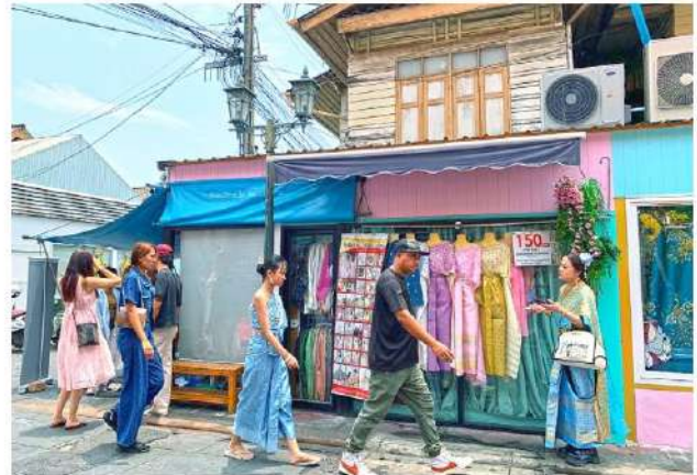
บรรยากาศหน้าร้านเช่าชุดไทย รวบรวมแฟชั่นสีสันสดใสเรียงราย และช่างแต่งตัวกำลังติดเครื่องประดับให้นักท่องเที่ยว

เราจะพบว่าสิ่งที่เชื่อมโยงนักท่องเที่ยวต่างชาติกับแหล่งท่องเที่ยว