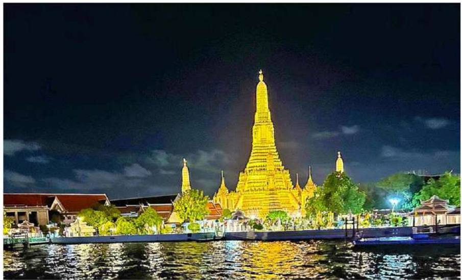
โครงสร้างพระปรางค์วัดอรุณฯ ยามค่ำคืน ณ ริมฝั่งแม่น้ำเจ้าพระยา

ประวัติศาสตร์ของไทย ไม่ใช่เพียงแค่ภาพถ่าย แต่คือ "ผืนผ้า" หรือ "ชุดไทย" ที่พวกเขาสวมใส่ ผ้าไทยไม่ได้ทำหน้าที่เป็นเพียงเครื่องนุ่งห่ม แต่ในมิติของการจัดการวัฒนธรรมถือเป็นจุดหมายเหตุที่สวมใส่ได้ ไม่ว่าจะเป็น ลวดลาย สีสัน วิธีการจับจีบไส ล้วนเป็นรหัส