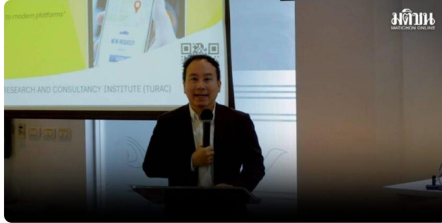
ม.ธรรมศาสตร์ เปิดผลวิจัย “อนาคต Ride-Hailing ไทย” ชี้ดัชนีดีพีประเทศทะลุ 5 หมื่นล้าน

เมื่อวันที่ 26 มีนาคม สถาบันวิจัยและให้คำปรึกษาแห่งมหาวิทยาลัยธรรมศาสตร์ จัดงานเปิดตัวรายงานผลการศึกษา “อนาคตของอุตสาหกรรมบริการเรียกรถรับจ้างออนไลน์ (Ride-Hailing) และผลกระทบต่อเศรษฐกิจและสังคมไทย” ซึ่งธุรกิจเรียกรถผ่านแอปฯ เด็บโตก้าวกระโดด คาดผู้ใช้งานพุ่งกว่า 16 ล้านคนภายในปี 2573 พร้อมแนะนำภาครัฐปรับตัวรับนวัตกรรมด้านราคา เพื่อสร้างความยั่งยืนให้ทั้งผู้โดยสารและคนขับ การศึกษาพบว่า อุตสาหกรรม Ride-Hailing ของไทยมีแนวโน้มเติบโตเฉลี่ย 10% ต่อปี โดยได้แรงหนุนจากพฤติกรรมของกลุ่ม Gen Z และ Gen Y ที่นิยมใช้รถรับจ้างผ่านแอปฯ ร่วมกับระบบขนส่งสาธารณะ แทนการซื้อรถยนต์ส่วนตัวที่มีต้นทุนราคาและการดูแลรักษา ธุรกิจนี้จึงกลายเป็นพื้นที่เชิงสำคัญที่สร้างผลิตภัณฑ์มวลรวมในประเทศ (GDP) ได้ถึง 30,000 – 50,000 ล้านบาทต่อปี หรือ 0.2 – 0.3% ของ GDP ประเทศ