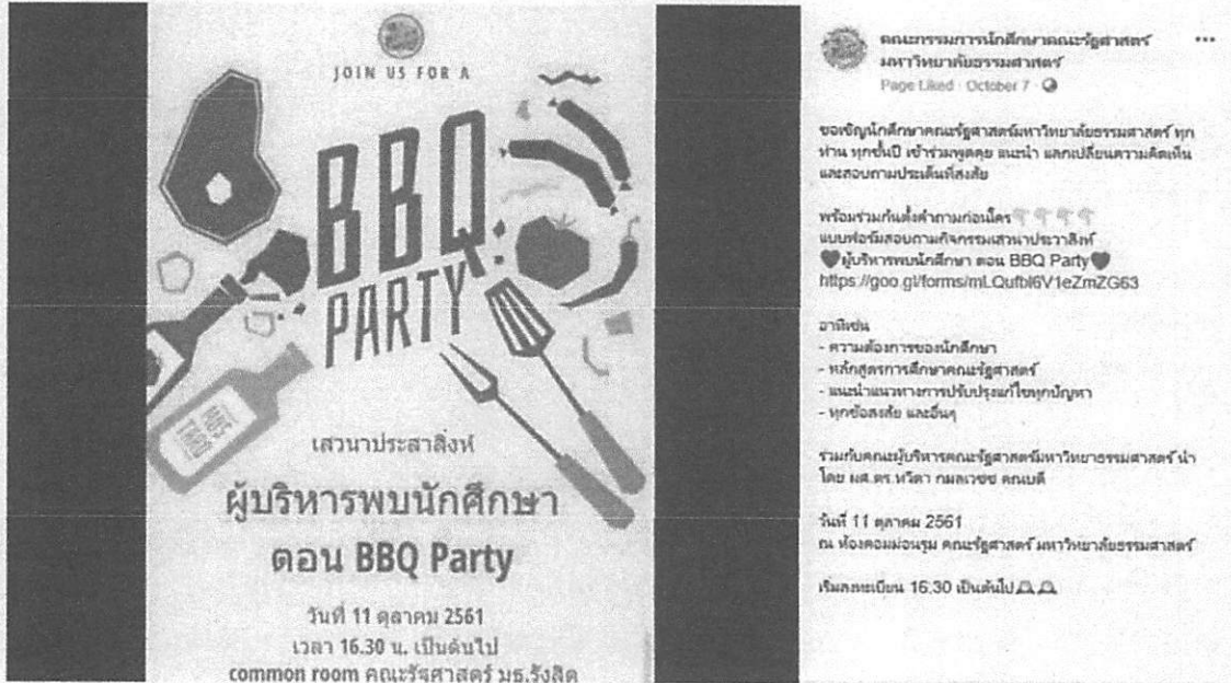
การประชาสัมพันธ์เมื่อวันที่ ๗ ตุลาคม ๒๕๖๑