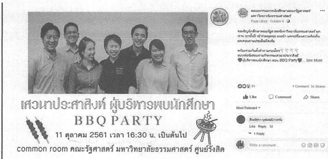
การประชาสัมพันธ์เมื่อวันที่ ๗ ตุลาคม ๒๕๖๑