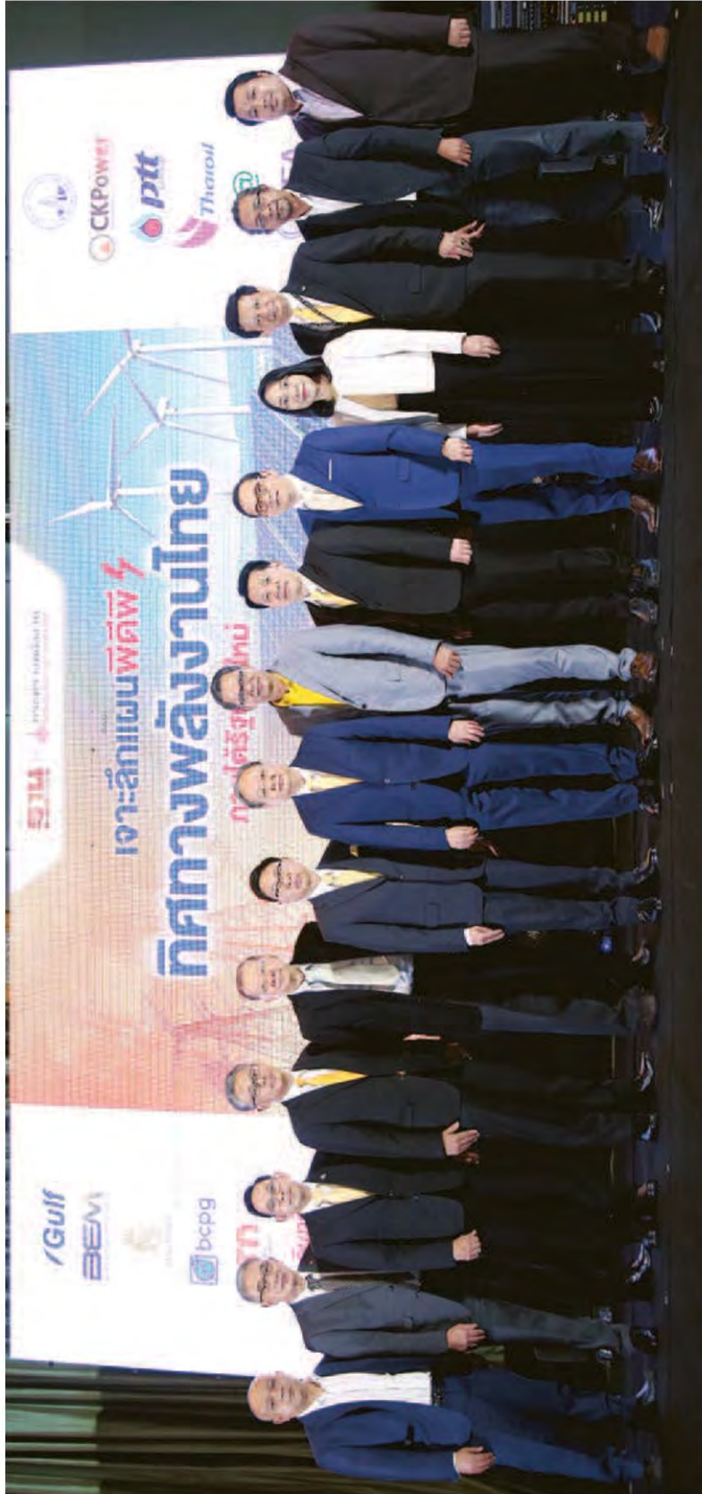
เวทีพลังงาน : นายสนธิรัตน์ สนธิจิรวงศ์ รมว.พลังงาน ถ่ายภาพร่วมกับวิทยากรผู้เชี่ยวชาญด้านพลังงานและผู้บริหารเครือข่ายเอกชนในโอกาสไปปาฐกถาพิเศษนโยบายและทิศทางการพลังงานในอาเซียน "เจาะลึก แผนพีดีพี ทิศทางพลังงานไทย ภายใต้รัฐบาลใหม่" จัดโดยหนังสือพิมพ์ฐานเศรษฐกิจ ณ ห้องแกรนด์ไฮแอท เอราวัณ กรุงเทพฯ วานนี้ (31 ก.ค.)