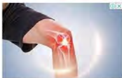
อาการปวดข้อหายไปทันทีหลังจากสิ่งนี้