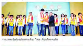
การแสดงขับขานประสานเสียง โดย เคียงโกลนศิลป์