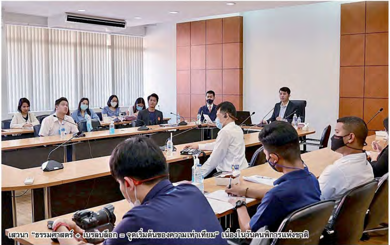
เสวนา “ธรรมศาสตร์ + เบลบล็อก = จุดเริ่มต้นของความเท่าเทียม” เนื่องในวันคนพิการแห่งชาติ

หัวข้อข่าว: พรุ่งนี้ที่ (ต้อง) ไม่เหมือนเมื่อก่อนของ 'คนพิการไทย'