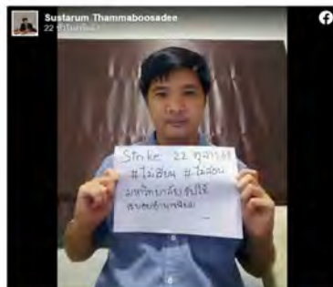
สืบเนื่องจากข้อเรียกร้อง หยุดสอนสอน ของนักศึกษา มธ.ลำปาง เพื่อเรียกร้องมหาวิทยาลัยให้หยุดเรียนและหยุดสอนว่า 'การชุมนุม' เป็นแค่ขบวนการและไม่ใช่ความเคลื่อนไหวของคน 48 ชั่วโมง ได้รับแจ้งจากนักศึกษาว่าไม่มีการตอบสนองใดๆจากมหาวิทยาลัย และขอเลิกได้โดยทันทีหากไม่เลิกดำเนินการเรียนการสอนจะเลิกเรียนทันที" และขอเลิกได้โดยทันทีหากไม่เลิกดำเนินการเรียนการสอนจะเลิกเรียนทันที

#เราต้องถามมหาวิทยาลัยมีใครอยู่เบื้องหลัง