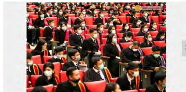
1/3 สไลด์ © สอนพิเศษ มจรจรัล