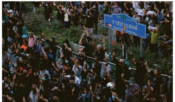
ยึดราชประสงค์ : มวลชนกลุ่มคณะราษฎร 63 นัดหมายชุมนุมกันที่บริเวณแยกราชประสงค์ เพื่อเรียกร้องให้พล.อ.ประยุทธ์ จันทร์โอชา นายกรัฐมนตรีและรมว.กลาโหม ลาออก พร้อมประกาศยกระดับชุมนุมหลังพันเส้นตาย 3 วัน ตามที่ระบุไว้ก่อนหน้านี้ วานนี้ (25 ต.ค.)

เพื่อไทย กล่าวว่า สำหรับประเด็นเรื่องขบวนการเสียดังนั้นเราได้หารือร่วมกับพรรคร่วมฝ่ายค้าน โดยจะมีการแบ่งบทบาทการอภิปราย เพราะมีเวลาจำกัด ส่วนพรรคที่จะให้ข้อเท็จจริง อาจจะเป็นพรรคก้าวไกล แต่ทั้งนี้ก่อนประชุมสภาฯ วันที่ 26 ต.ค. จะมีการหารือกันอีกครั้ง ขณะที่นายอรรถกร ศิริลัทธยากร ส.ส.บัญชีรายชื่อ พรรคพลังประชารัฐฐานะกรรมการประสานงานพรรคร่วมรัฐบาล (วิปรัฐบาล) กล่าวนายวิรัช รัตนเศรษฐ