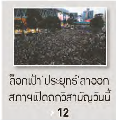
ล็อกเป้า 'ประยุทธ์' ลาออก สภาพเปิดถกวิสามันต์วันนี้ 12