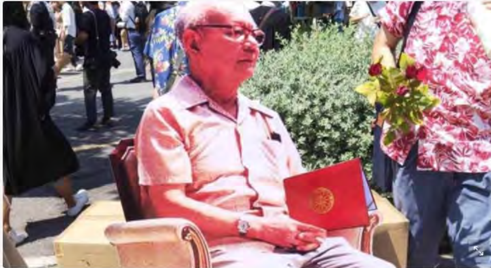
ภาพไฮไลต์

อัปเดต 11 ชั่วโมงที่ผ่านมา • เผยแพร่ 11 ชั่วโมงที่ผ่านมา