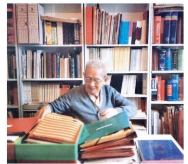
ดร.ปรีดี พนมยงค์ นักคิดนักเขียน ประชาธิปไตย

วันที่ ๑๔ พฤษภาคม ๒๕๖๖ นี้ ขอเชิญชวนทุกคนไปใช้สิทธิเลือกตั้งโดยทั่วกัน เพื่อสร้างรากฐานของประชาธิปไตย ซึ่งทำให้เรานึกถึงวันบุคคลสำคัญของแผ่นดินและเป็นบุคคลสำคัญของโลกที่รู้จักกันดีคือ วันปรีดี พนมยงค์ ด้วยเมื่อวันที่ ๑๑ พฤษภาคม ที่ผ่านมามีเป็นวันชาติกาลของนายปรีดี พนมยงค์ เมื่อวันที่ ๑๑ พฤษภาคม พ.ศ.๒๕๔๓ ด้วยท่านเป็นผู้มีบทบาทสำคัญในเหตุการณ์ประชาธิปไตยอยู่มากมาย เช่น เป็นหัวหน้าคณะราษฎรสายพลเรือน ผู้นำการปฏิวัติสยาม พ.ศ. ๒๔๗๕ เปลี่ยนแปลงการปกครองของประเทศ