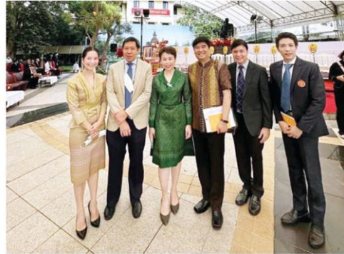
คณะอาจารย์มหาวิทยาลัยธรรมศาสตร์

เป็นหัวหน้าคณะราษฎรสายพลเรือน ผู้ประศาสน์การ (ผู้ก่อตั้ง) มหาวิทยาลัยวิชาธรรมศาสตร์และการเมือง และเป็นผู้ก่อตั้งธนาคารชาติไทย คือ เริ่มต้นจากสามัญชนผู้เกิดในครอบครัวชาวนาของเมืองกรุงเก่า ในจังหวัดพระนครศรีอยุธยา ซึ่งได้รับการส่งเสริม