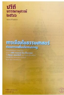
หนังสือปรีดี บรรณานุกรม ๒๕๖๖