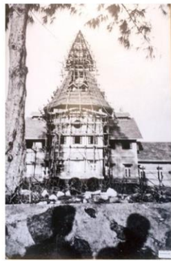
วางรากฐานสร้างมหาวิทยาลัย ธรรมศาสตร์และการเมือง