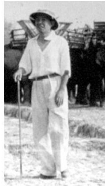
ดร.ปรีดี พนมยงค์ ผู้ประศาสน์การ มธ.

คอลัมน์: ภูมိบ้าน ภูมิเมือง: 'วันปรีดี พนมยงค์' ภูมิรัฐบุรุษอาวุโสประชาธิปไตย