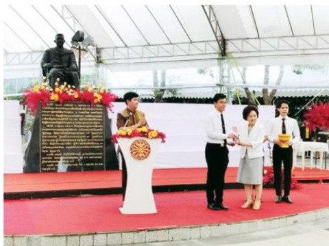
กิจกรรม มธ. วันปรีดี พนมยงค์

จากระบบอบสมบูรณาญาสิทธิราชย์มาเป็นประชาธิปไตย, ผู้นำขบวนการเสรีไทย ต่อต้านญี่ปุ่นในสงครามโลกครั้งที่สอง และรัฐบุรุษอาวุโสคนแรกของประเทศไทย จึงมีการจัดงานที่ระลึกโดยองค์กรต่างๆ เช่น งานที่ระลึก ดร.ปรีดี พนมยงค์ ผู้ประศาสน์การ (อธิการบดี) คนแรกของมหาวิทยาลัยธรรมศาสตร์ ซึ่งพิธีสักการะรูปหล่ออนุสาวรีย์เพื่อระลึกถึงคุณูปการทางวิชาการ ที่มีดำริรับตำราหลายเล่มจากผู้ประศาสน์การและศิษย์คนสำคัญของท่าน และกิจกรรม “ปาฐกถาวันปรีดี พนมยงค์” จัดโดยสถาบันปรีดี พนมยงค์ ซึ่งเชิญนักคิดนักวิชาการคนสำคัญมาเป็นองค์ปาฐก “ปาฐกถาปรีดี พนมยงค์” ทุกปี จึงเป็นองค์ความรู้จากครูบาอาจารย์ นักวิชาการคนสำคัญที่สืบทอดกันมาจนวันนี้ นายปรีดี พนมยงค์ นั้นเป็นนักกฎหมาย อาจารย์ นักกิจกรรม นักการเมือง และนักการทูตชาวไทย ผู้ได้รับการยกย่องเกียรติคุณอย่างสูง เป็นรัฐบุรุษอาวุโส ผู้สำเร็จราชการแทนพระองค์ นายกรัฐมนตรีคนที่ ๗ และรัฐมนตรีหลายกระทรวง