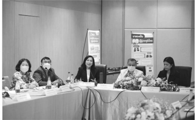
มธ.-สสส. เปิดรายงานทัศนคติผู้สูงอายุในสังคมไทย

การมองผู้สูงอายุต่อความเป็นเรื่องไม่ถูกต้อง นางกรณีให้ภาพผ่านการทำงานของ สสส. ร่วมกับภาคี มีการพัฒนางานต้นริผู้สูงอายุ Bennetty 3 รุ่น เพื่อแสดงให้เห็นศักยภาพ และเป็นแรงบันดาลใจให้ผู้สูงอายุในการทำสิ่งที่สนใจ, กิจกรรม Workshop "เราต่าง