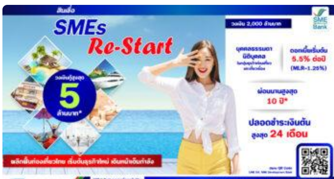
SME D Bank เปิดตัว 'สินเชื่อ SMEs Re-Start' หนุนเอสเอ็มอีรับท่องเที่ยวฟื้น