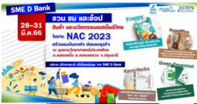
SME D Bank ยกขบวนลูกค้านวัตกรรมโชว์ศักยภาพเสริมฟิตรงถึงมือผู้บริโภค ในงาน 'NAC2023'