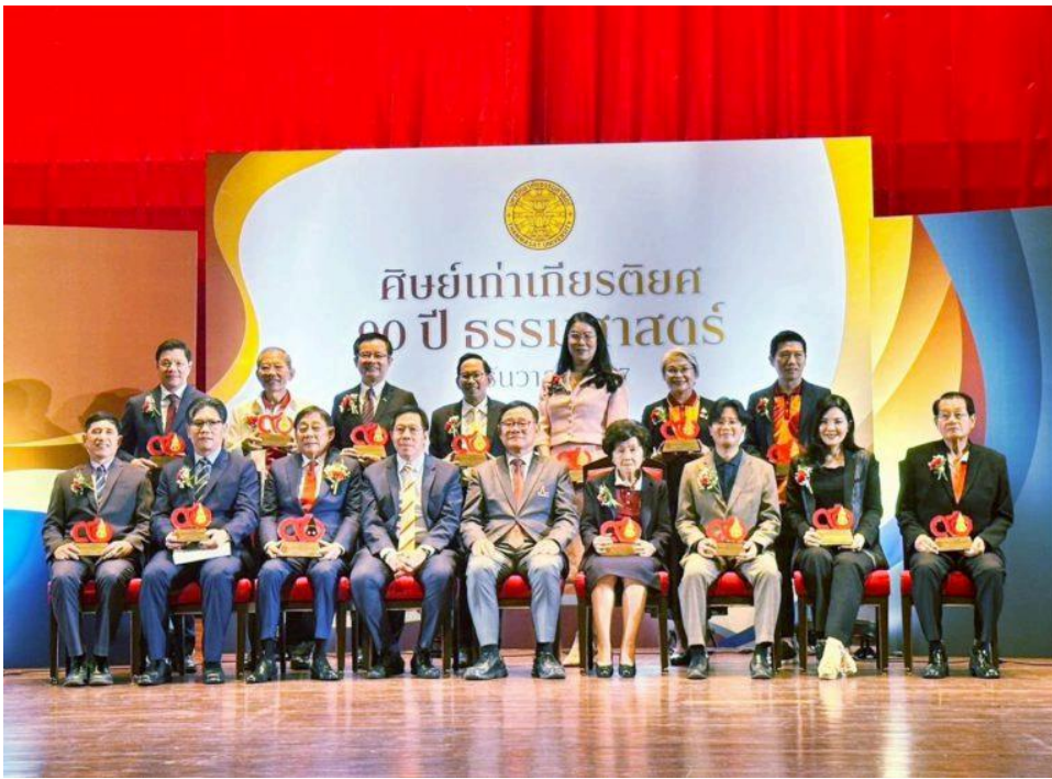
( http://www.krungthepnews.com/wp-content/uploads/2024/12/S__222986248_0.jpg )