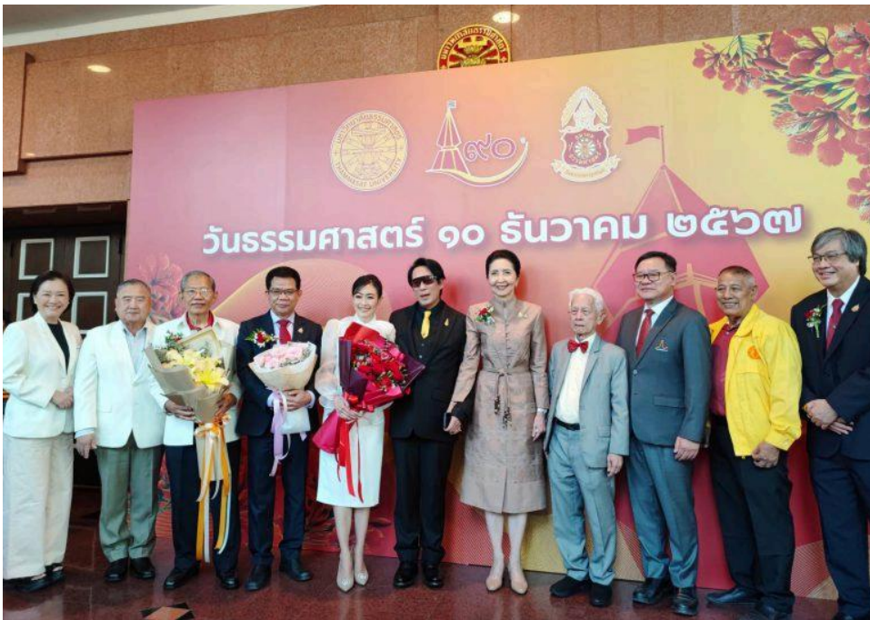
( http://www.krungthepnews.com/wp-content/uploads/2024/12/S__222986251_0.jpg )