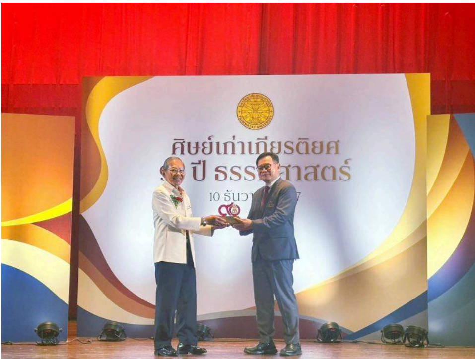
( http://www.krungthepnews.com/wp-content/uploads/2024/12/S__222986246_0.jpg )