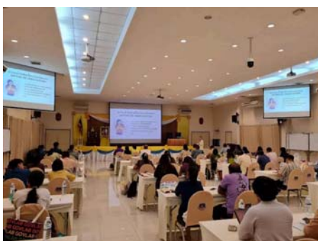
( https://www.thailandplus.tv/archives/799098/attachment/2754308 )