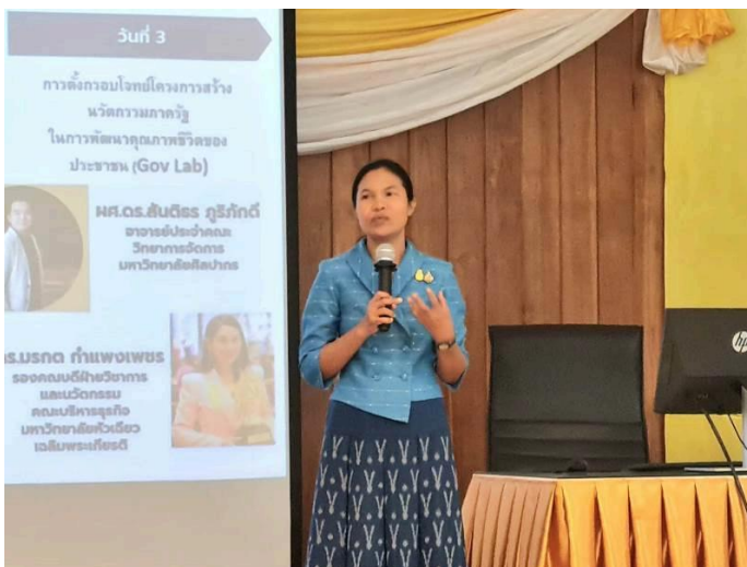
( https://www.thailandplus.tv/archives/799098/attachment/2754305 )