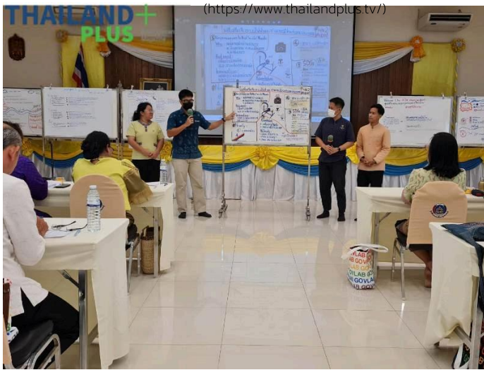
( https://www.thailandplus.tv/archives/799098/attachment/2754495 )