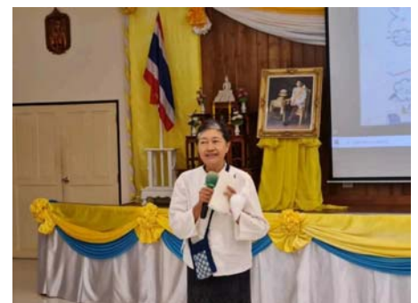
( https://www.thailandplus.tv/archives/799098/attachment/2754307 )