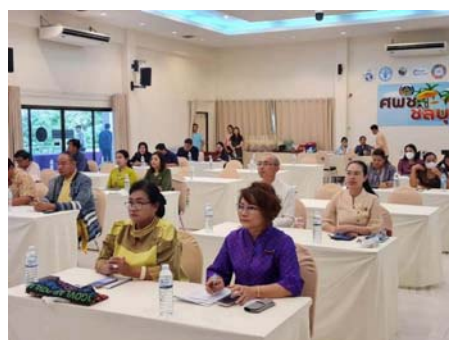
( https://www.thailandplus.tv/archives/799098/attachment/2754309 )