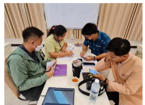
( https://www.thailandplus.tv/archives/799098/attachment/2754310 )