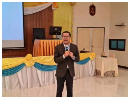
( https://www.thailandplus.tv/archives/799098/attachment/2754306 )