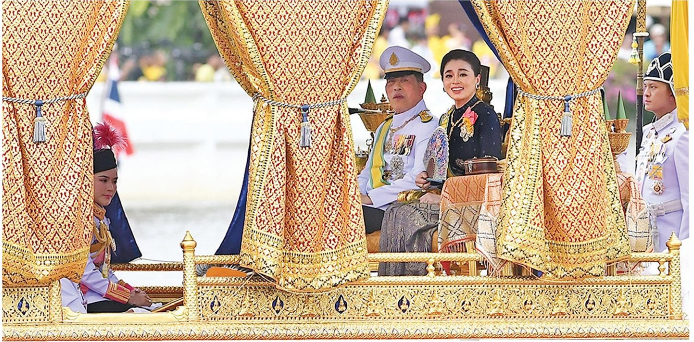
พระบาทสมเด็จพระเจ้าอยู่หัว และสมเด็จพระนางเจ้า พระบรมราชินี เสด็จพระราชดำเนินประทับเรือพระที่นั่งสุพรรณหงส์ ในขบวนพุทธยาตราทางชลมารคไปทรงบำเพ็ญพระราชกุศลถวายผ้าพระกฐิน ณ วัดอรุณราชวรารามราชวรมหาวิหาร โอกาสนี้สมเด็จพระเจ้าลูกเธอ เจ้าฟ้าสิริวัณณวรีฯ และสมเด็จพระเจ้าลูกยาเธอ เจ้าฟ้าทีปังกรรัศมีโชติฯ โดยเสด็จในการนี้ด้วย เมื่อวันที่ 27 ตุลาคม พ.ศ.2567

หัวข้อข่าว: ปิติ 2 ลั่นเกล้า ถวายกุญแจ พุทธยาตราชลมารค