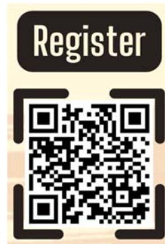
รูปแบบออนไลน์

ผู้ที่สนใจสามารถดูรายละเอียดเพิ่มเติมได้ที่ รูปแบบการเรียน : In-Class https://shorturl.asia/ZPnvr สมัครได้ที่ https://shorturl.asia/59ajl และ รูปแบบออนไลน์ https://shorturl.asia/PIUBc สมัครได้ที่ https://shorturl.asia/GUMoE